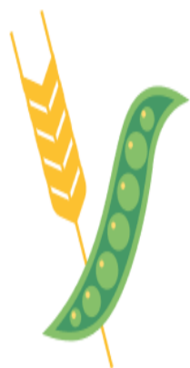
СТРУКТУРА ПОСЕВНЫХ ПЛОЩАДЕЙ ЗЕРНОВЫХ И ЗЕРНОБОБОВЫХ КУЛЬТУР В ХОЗЯЙСТВАХ ВСЕХ КАТЕГОРИЙ, В % ОТ ВСЕЙ ПОСЕВНОЙ ПЛОЩАДИ